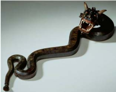
Cornet à bouquin, Italy, XVIe Italie, XVIe: 2 corps en bois fruitier recouverts de cuir peint, doré avec des filets rouges

Rarement glorifié comme peuvent l'être l'érable ondé ou l'épicéa, tous deux tant admirés sur les violons, le cuir est fréquemment présent dans la facture instrumentale. Discret, on le croit le plus souvent relégué au rôle de matériau accessoire. On le croise employé comme charnières dans les mécaniques des pianos, lamelles des clapets dans l'accordéon. Il sait se faire baudruce, poucettes d'archets ou encore bec de clavecin. Seconde peau, on le trouve employé comme revêtement de protection et d'étanchéité, enveloppant le corps des instruments à vent d'une parure sobre et résistante, protégeant des chocs mécaniques comme hygroscoPIques.